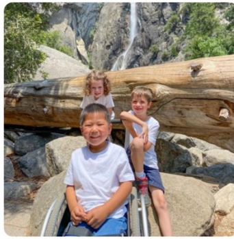
There are several wheelchair accessible trails at Yosemite National Park including Lower Yosemite Falls loop.