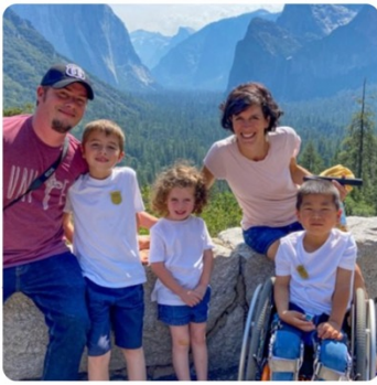
Yosemite National Park offers loaner wheelchairs, hand-cranked bicycle rentals and wheelchair-accessible sites at each campground.