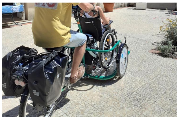
Služby pro osoby s pohybovým omezením